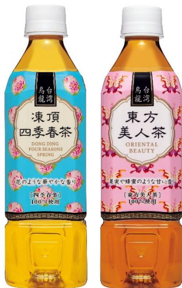
ハイピース 台湾烏龍 凍頂四季春茶